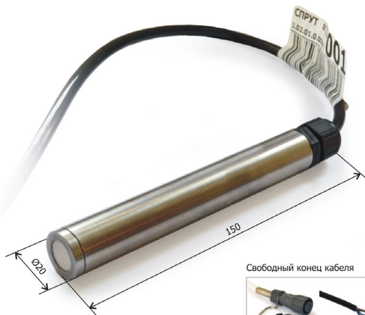
Свободный конец кабеля